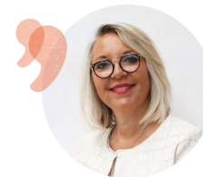
Laurence FAUTRA MAIRE DE DÉCINES-CHARPIEU

Hâte de vous y retrouver pour partager de formidables moments ensemble.