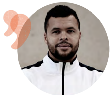
Jo-Wilfried TSONGA CO-FONDATEUR ALL IN GROUP

Le sport véhicule des valeurs auxquelles je suis très attaché. Gagner a été un objectif quotidien pour moi, mais le sport ne se réduit pas à la seule victoire. Apprendre, partager, échanger et se rencontrer sont les maîtres-mots de ce projet sportif, éducatif et récréatif.